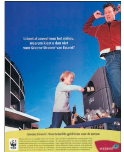
Maatschappelijk verantwoorde corporate uiting van Essent

Toch lijkt de ingezette maatschappelijke trend zich niet te keren, als we recente gegevens mogen geloven. Zoals de Environics Corporate Social Responsi-