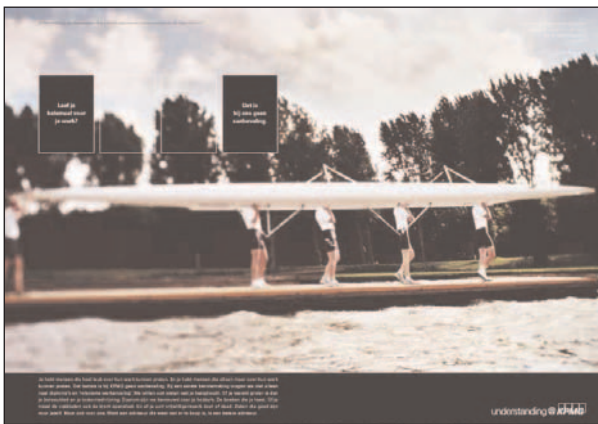
Personeelsadvertentie met mvo van KPMG